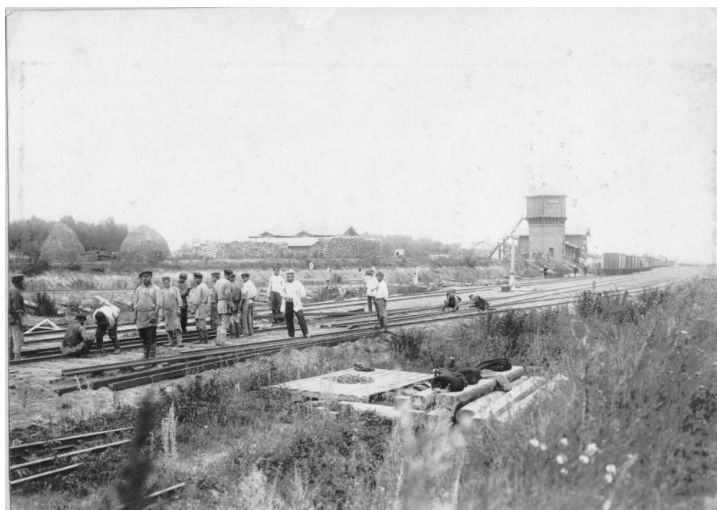
Строительство железной дороги вблизи заводов «Товарищества Кольчугина», середина 90-х гг. XIX века