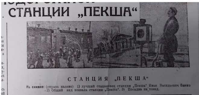
Железнодорожная станция «Пекша»