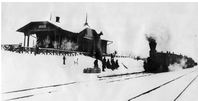
Железнодорожная станция «Келерово»