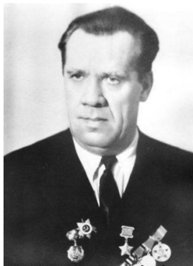
Герой Советского Союза В.П. Сосин

Коллеги вспоминают его компетентность, отзывчивость, скромность. Только на выпускном вечере одноклассники его дочери узнали, что учились вместе с дочерью Героя Советского Союза.