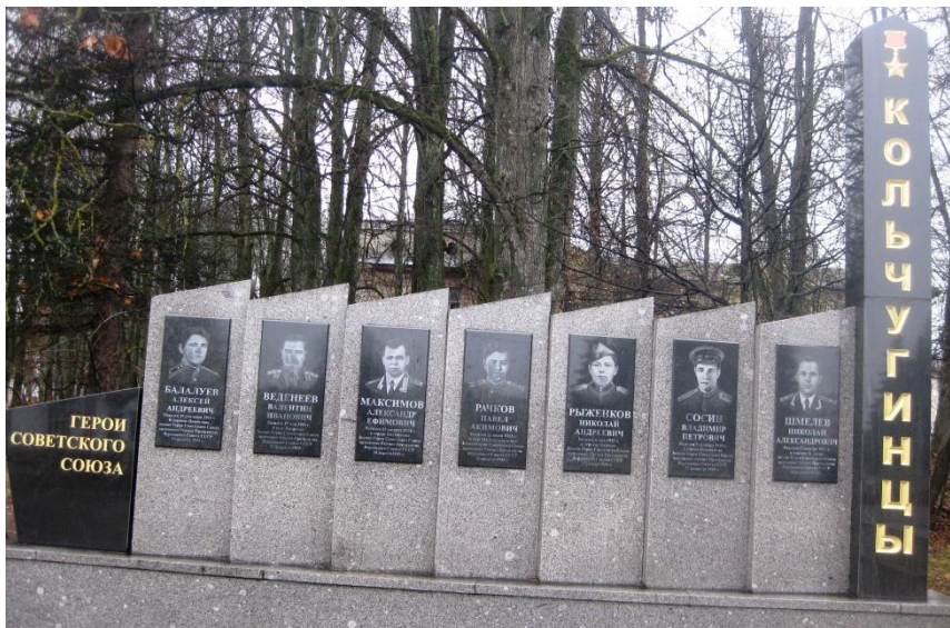
Фото 14. Мемориал в г. Кольчугино.

В его родном городе Кольчугино Владимирской области на мемориале в центре города среди семи Героев Советского Союза – кольчугинцев установлена стела в честь В.П. Сосина (фото 14).