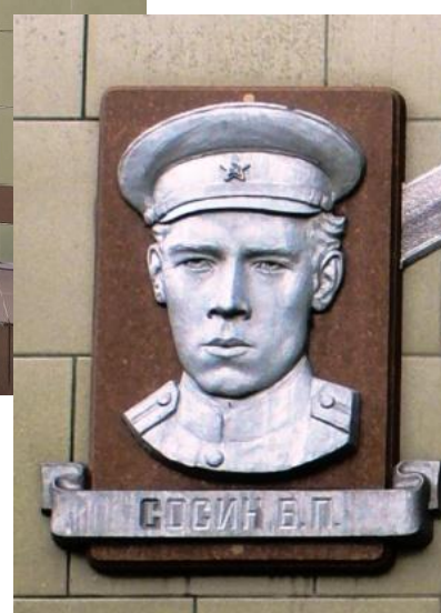
Фото 15. Мемориальная доска на здании школы в г. Орехово-Зуево