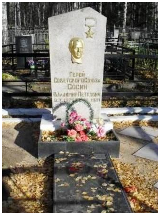
Фото 13. Памятник на захоронении В.П. Сосина