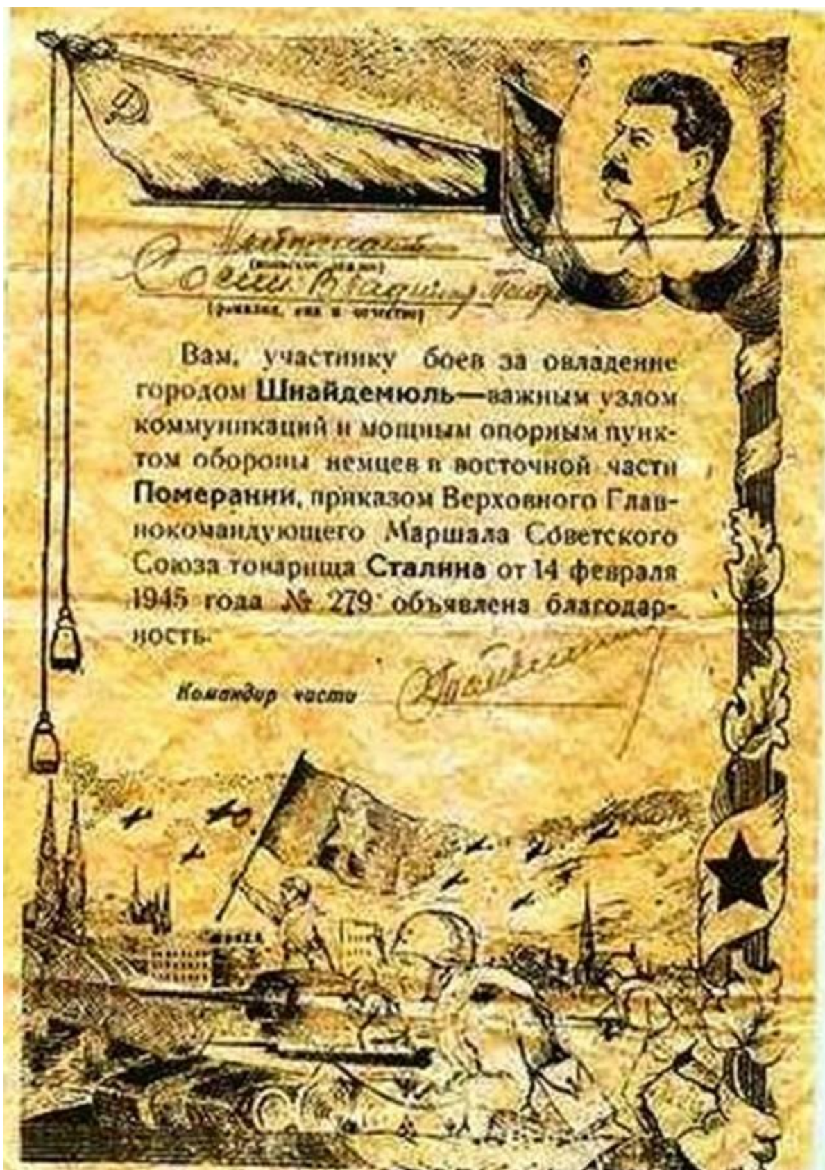
Фото 9. Благодарность за участие в шнейдемюльской операции