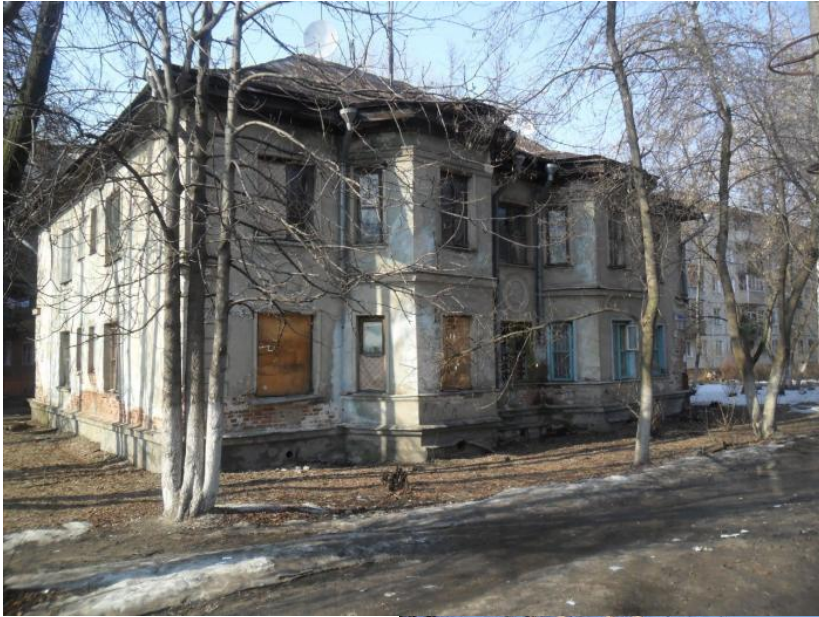
Фото 3. Орехово-Зуево. Микрорайон «Карболит»