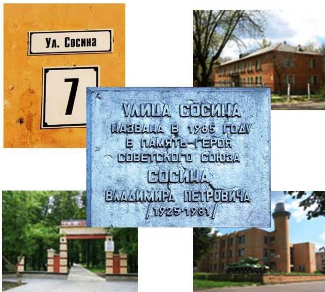
Фото 16. Саров. Улица Сосина.