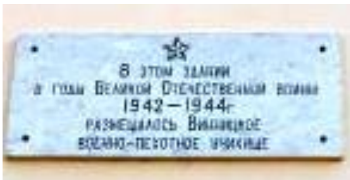
Фото 4. Суздаль. Мемориальная доска на бывш. Архиерейских палатах. Сейчас – здание ЦВР.

После полугода учёбы В.П. Сосин был выпущен из училища и 15 августа 1943 года направлен в действующую армию, в 1281-го стрелковый полк 60-й стрелковой дивизии. Дивизия входила тогда в состав Центрального фронта.