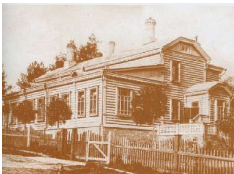
Школа для заводских детей, 1896 год.