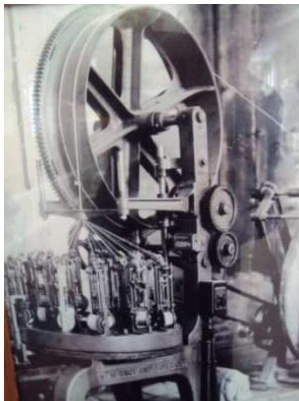
Кабельный завод, английский крутильный станок, 1900 год.

В 1899 году по проекту австрийского архитектора С. Баура начинается строительство кабельного завода, которое было завершено в 1900 году. По воспоминаниям Баура Кольчугинский кабельный завод был первым электрифицированным предприятием в Европе. В 1896 году на заводах Товарищества Кольчугина установлена электромашинка типа «Шихау» 120 л.с. В 1899 году была дополнительно установлена более мощная электроустановка трехфазного тока мощностью 320 лошадиных сил. Так была создана первая опытная электростанция.