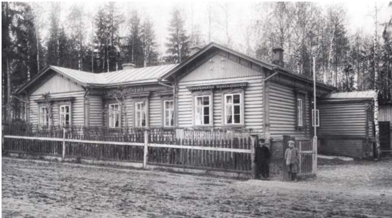
Один из домов на улице Немецкой (ныне улица III Интернационала)

При строительстве сохраняется лес, при домиках разбиваются огороды. В этих домах поселяют немецких специалистов. А улицы называют Немецкая и Больничная.