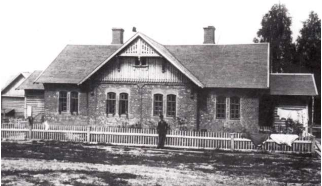
Один из домов на улице Кооперативной (ныне улица Зернова), названной в народе Каменкой.

В течении семи лет с 1898 года строятся четырехквартирные каменные дома. Так появляются первые улицы в поселке – Большая и Кооперативная. Всего было построено 20 домов для мастеров и опытных рабочих.