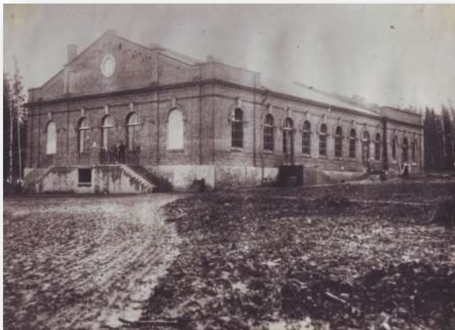
Театр-чайная. 1902 год

Для приезжих (командировочных) строится двухэтажная гостиница рядом с домом управляющего. В дома, рабочие казармы поступает вода из артезианской скважины. Дома и улицы поселка освещаются за счет заводской электростанции. Для сравнения следует добавить, что во Владимире в это время освещался только дом губернатора. Создаются социальные службы: баня (1899 г.) столовая на 500 мест (1902 год), продуктовые лавки, магазины потребительской кооперации. Рабочим выдаются беспроцентные ссуды на жилье. Настоящей гордостью Штуцера стало открытие Народного дома (1902 г.).