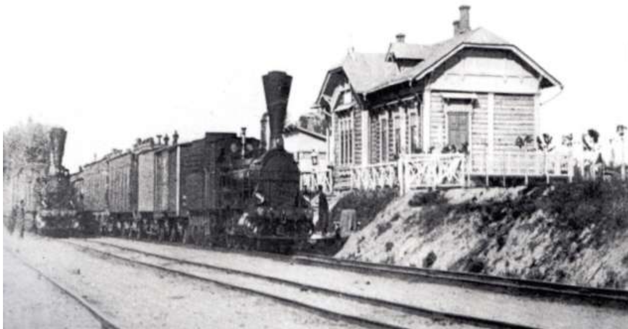
Первые товарный и пассажирский поезда. Конец 19 века

В 1904 году рядом с заводом на улице Больничной строится здание почты, телеграфа и телефона. В заводе создается пожарный обоз, строится узкоколейка для перевозки слитков.