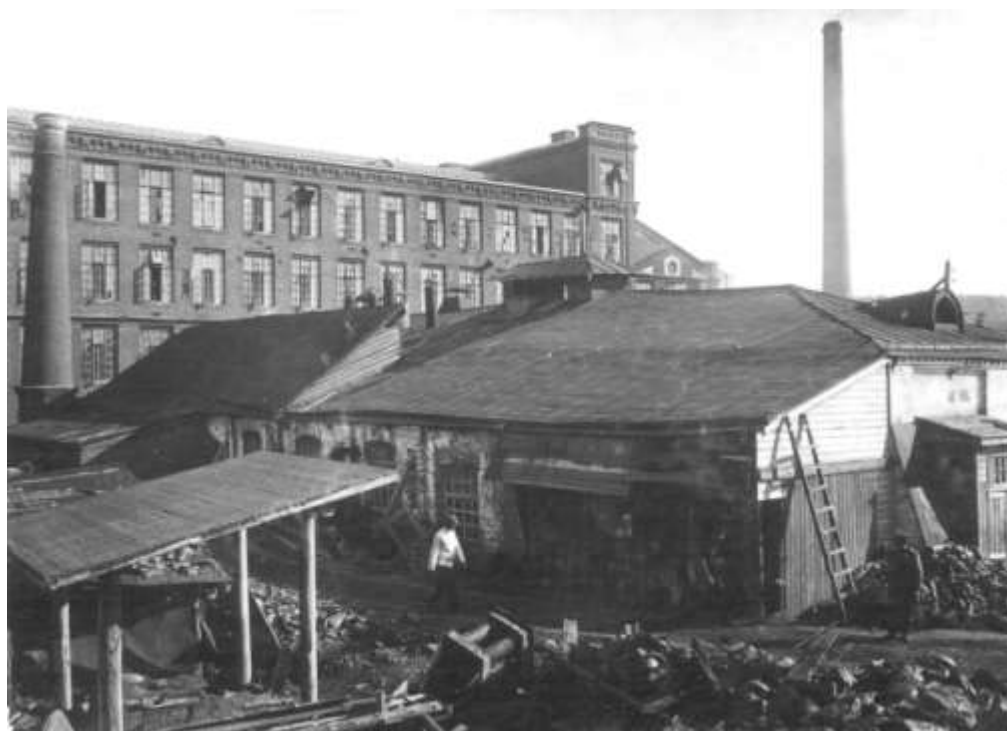
На переднем плане здание посудно-штамповочного производства, построенного в 1897 г.

При этом денег на самое современное оборудование Штуцер не экономил.