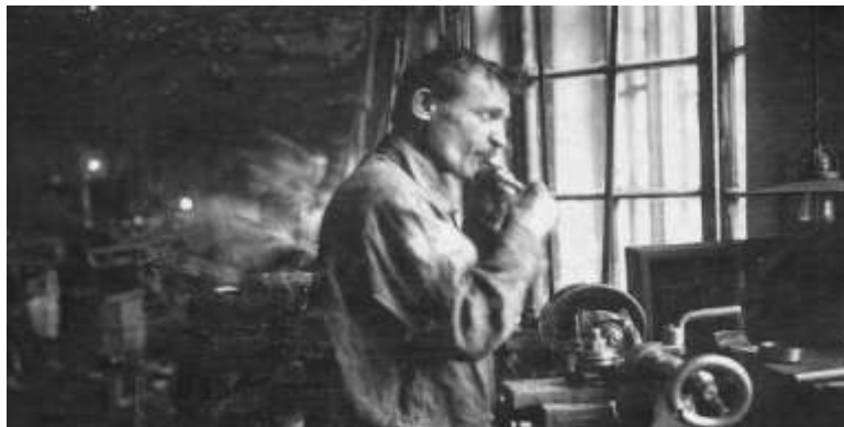
Прибор продувки воздухом

провода для Москвы и Петрограда. Из донесения Юрьевского исправника губернатору во Владимир: «На заводе имеется каменный проволочный корпус с тремя прокатными станами, 50 проволочными барабанами и тремя печами для нагревания проволоки... Также имеется каменное здание для выделки медных канатов, кабелей и изолированной проволоки. В этом здании (цехе) несколько отделов: кабельный, свинцово-прессовый, тендем крутильный, бронировочный, круглопроволочный и отдел по работе с ленточным железом.» 2