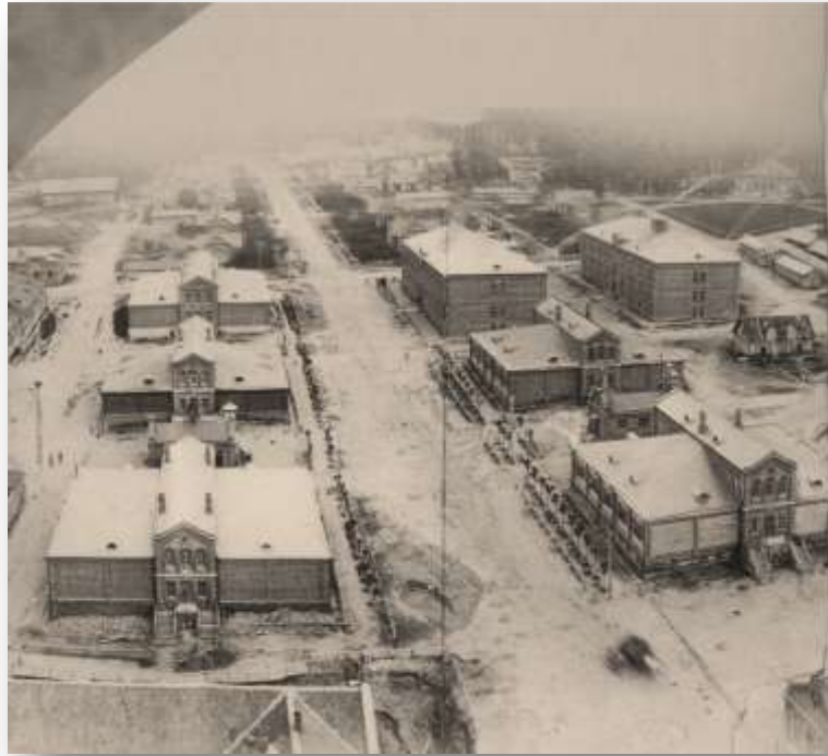
1894-1904 гг. – построены 7 казарм для рабочих.

В течении семи лет с 1898 года строятся четырехквартирные каменные дома. Так появляются первые улицы в поселке – Большая и Кооперативная. Всего было построено 20 домов для мастеров и опытных рабочих.