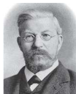
П.Н. Милюков, лидер партии кадетов.