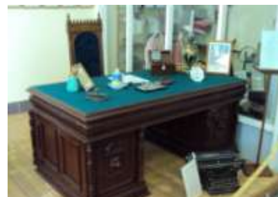
Уголок конторы управляющего из экспозиции музея завода "Электрокабель."