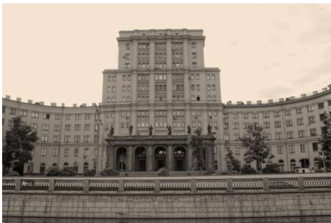
МВТУ им. Баумана