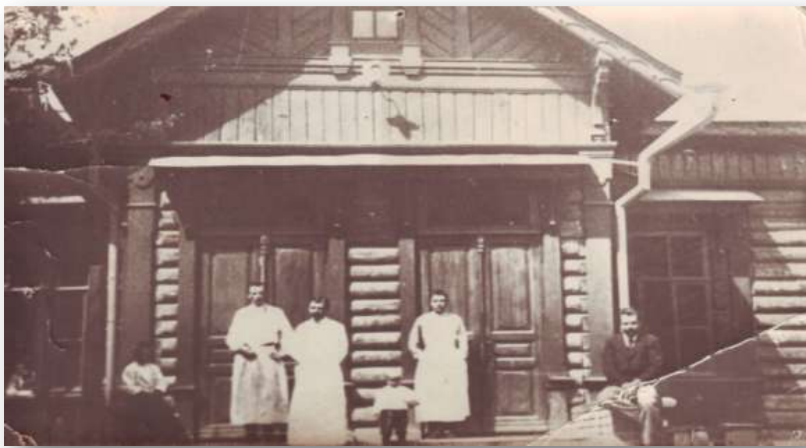
Улица Больничная (ныне улица Ленина), фасад заводской больницы, 1896 год

На последней улице в 1896 году строится больница, которая в следующем году была расширена и открыто родильное и инфекционное отделения.