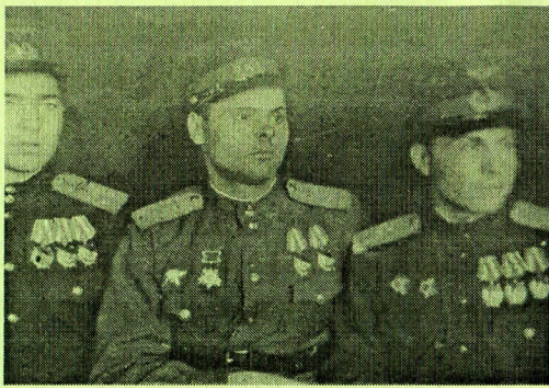
С однополчанами, крайний справа.

После войны продолжал службу на должности командира эскадрильи 165-го гвардейского штурмового авиационного полка. В июле 1947 года в качестве лётчика-инструктора перешёл в авиачасть Центрального Спортивного Общества СССР (ЦСО СССР) с оставлением в военных кадрах. Трагически погиб 9 декабря 1947 года при исполнении служебных обязанностей. Похоронен в городе Таллин, столице республики Эстония. Награждён орденом Ленина (18 августа 1945), 3 орденами Красного Знамени (25 октября 1943; 30 января 1944; 15 января 1945), 2 орденами Отечественной войны I степени (30 мая 1944; 11 мая 1945), орденом Отечественной войны II степени (17 января 1944), медалями. Именем Героя названы улицы в посёлке Бавлены и в городе Юрьев-Польский Владимирской области.