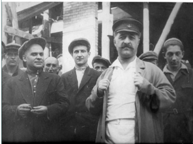
Серго Орджоникидзе – нарком тяжёлой промышленности СССР