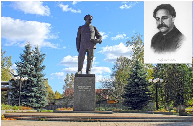
Памятник С. Орджоникидзе в г. Кольчугино