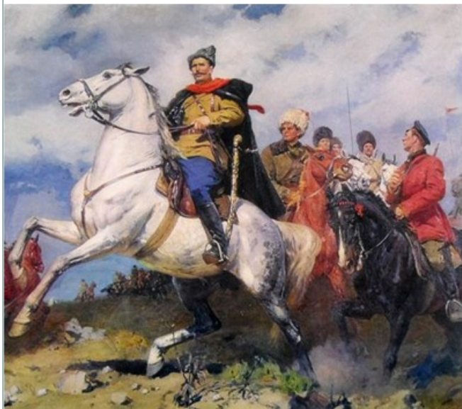
Кольчугино, Владимирская область

Увековечен в книге Д.А. Фурманова «Чапаев». Его имя присвоено множеству населённых пунктов, улиц, боевых и гражданских кораблей, в годы Великой Отечественной войны имя Чапаева носили партизанские отряды. В Кольчугино именем прославленного героя названа одна из улиц города.