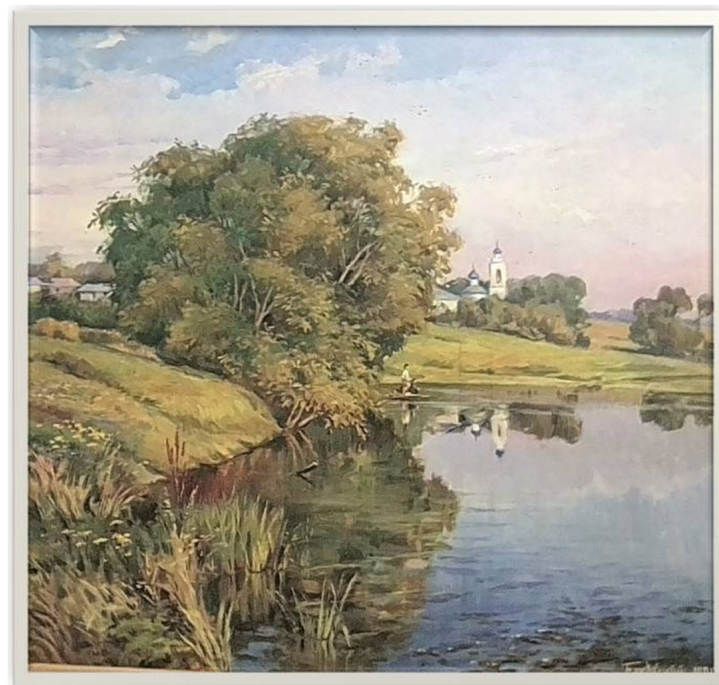
Б.А. Бяковский «Вид на Пекшинское водохранилище у с. Давыдовского»

Это - городской пейзаж с заводской трубой и силуэтами цехов вдали, в центре – дамба на реке Беленькой, вверху небо с яркими колоритными облаками. И вот как это место выглядит в наши дни, спустя почти 70 лет. Сейчас это благоустроенная городская набережная, вместо тропинок пешеходные тротуары.