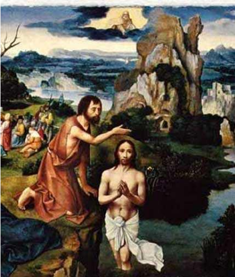
Крещение Иисуса Христа (худож. картина)

Прежде чем рассказать о сельском храме, необходимо уточнить, что такое Богоявление. Это великий, один из самых древних церковных праздников Христианской церкви, иначе называемый праздником Крещения Господня . В этот день церковь вспоминает Крещение Спасителя в Иордане от Иоанна Предтечи. Праздник назван Богоявлением потому, что при Крещении Спасителя в Иордане было особое явление всех трёх лиц Божества: Отца небесного, Святого Духа в виде голубя. После Крещения Иисус явил себя миру как Христос , сын Божий. А Христос по-гречески означает помазанник Божий. Крещение, или Богоявление, празднуется православными 19 января по новому стилю. В память того, что Спаситель Своим Крещением освятил воду, отмечается водосвятие . Это ещё один древнейший обряд и часть празднования Богоявления. В Древней Руси он назывался водокрещением. Вода крещенская издревле считалась великою святынею, её хранят целый год, ею окропляют вещи, принимают в болезни. Обряд крещения