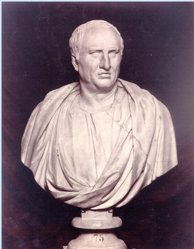
Знаменитый римский оратор, консул, юрист