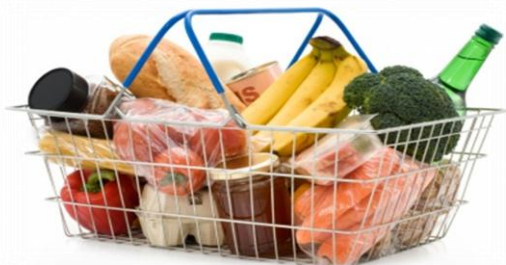
Материал из ЭБД «КонсультантПлюс»

Скорее всего, конфликт закончится на этапе требования жалобной книги. Если нет, предложите магазину подать на вас в суд. Судебные издержки и неизбежные визиты проверяющих инспекций охладят пыл сотрудников и позволят вам выйти из ситуации с гордо поднятой головой.