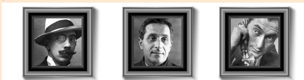
Александр Беляев, Михаил Зощенко, Евгений Петров

Евгений Петров , работавший в соавторстве с Ильфом, три года работал инспектором одесского уголовного розыска. Об этом периоде жизни сказано: «Первым его литературным произведением был протокол осмотра трупа неизвестного мужчины». В 1922 году, во время погони с перестрелкой, лично задержал своего друга Александра Козачинского, возглавлявшего банду налётчиков. Впоследствии добился пересмотра его уголовного дела и замены Козачинскому высшей меры социальной защиты – расстрела – на заключение в лагере.