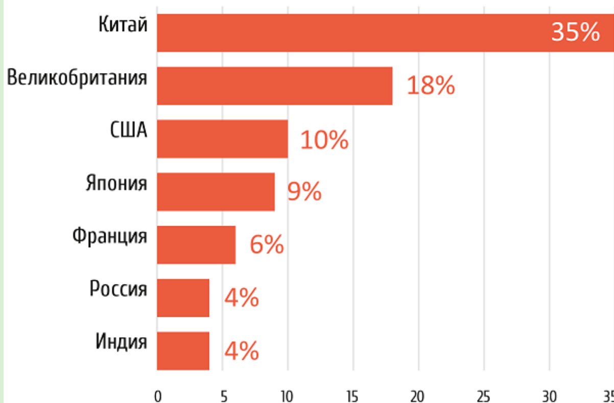
Рис. 1. Доля продаж в сегменте электронной коммерции от общего объема розничных продаж, 2018 г.